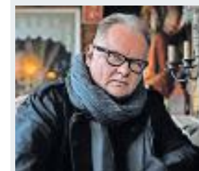
ebenso erzählen wie von unbeugsamen Trotz.

Auch mit über 60 zieht es Kunze noch immer regelmäßig „Raus auf die Straße“. Mit der Eröffnungsnummer des neuen Albums liefert der Rockpoet nicht nur das Motto zur Tour, sondern feiert, stiehlt mit Springsteen-Klavier, den Aufbruch und die stetig andauernde Liebe zu seinem Publikum. Das neue Album – Kunzes sechsendreißigstes seit 1981 – richtet „Schöne Grüße vom Schicksal“ aus. Fünfzehn Songs, die von Schicksalsergebenheit